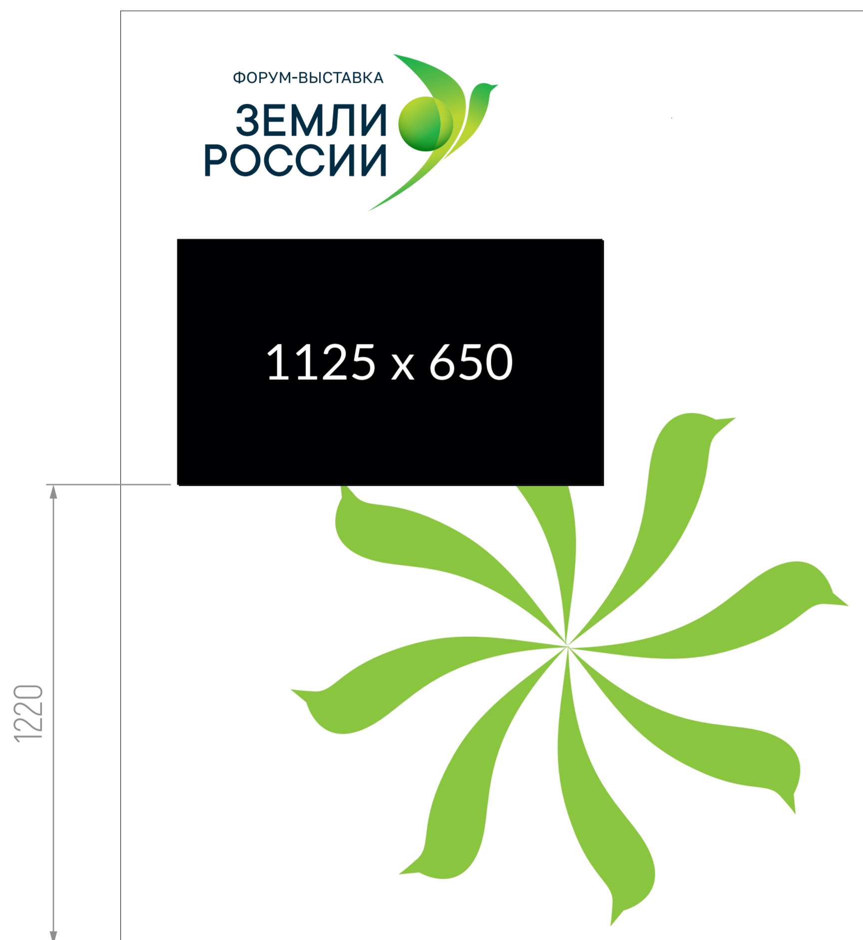
1980x2475 мм (левый)